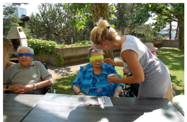
Activités physiques et atelier mémoire