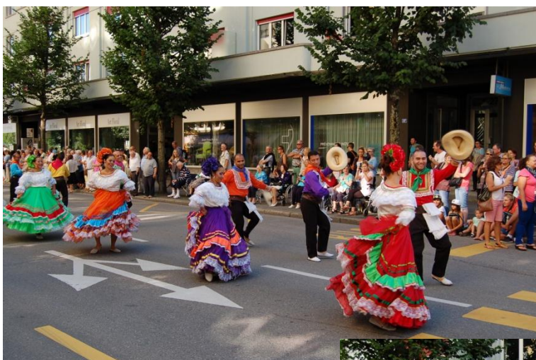
Sortie aux RFI