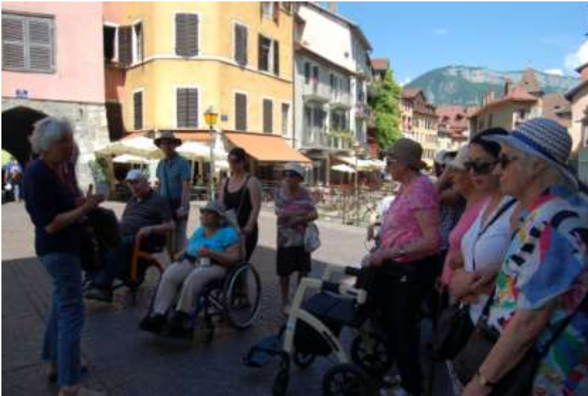
Après la visite guidée de la vieille ville d'Annecy