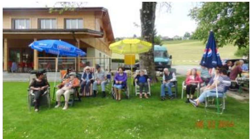
Sortie à Gumefens