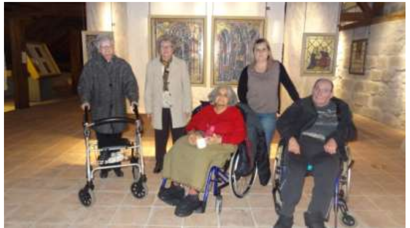
Musée du vitrail à Romont