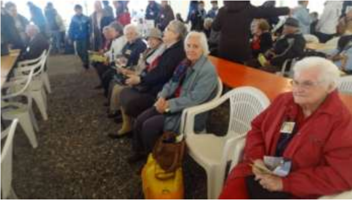
Pèlerinage de Notre Dame des Marches